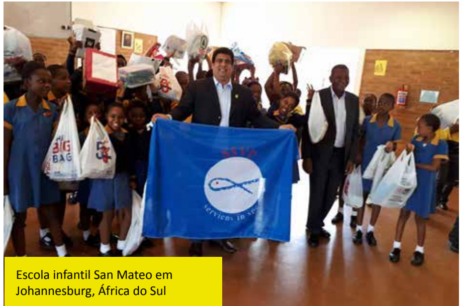
Escola infantil San Mateo em Johannesburg, África do Sul

Na ZAMBIA , além dos acompanhamentos aos enfermos em hospitais e das visitas aos lares das famílias mais necessitadas ,