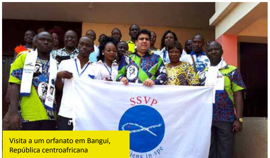
Visita a um orfanato em Bangui, República centroafricana

O Presidente Geral deseja regressar à África no ano 2020 com o objetivo de visitar outros quatro países e participar do II Encontro “All Africa”.