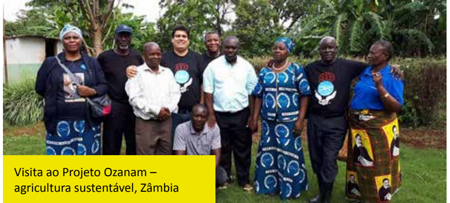
Visita ao Projeto Ozanam – agricultura sustentável, Zâmbia

Em BOTSUANA , o Presidente Geral pôde visitar um Centro de Acolhida para menores dirigido pela Conferência Cristo Rei, que acolhe meninos de até 18 anos provenientes de áreas rurais para que possam estudar na cidade. Está em construção um albergue para pessoas sem lar pela Conferência Santa Cruz, assim como um albergue infantil “pequenos amigos”, que é de responsabilidade da Conferência São Gabriel.