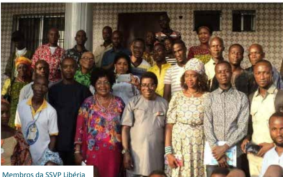
Membros da SSVP Libéria

APÓS VISITAS MISSIONÁRIAS E UM ÁRDUO TRABALHO DE FORMAÇÃO, TEMOS A IMENSA ALEGRIA DE INFORMAR QUE A LIBÉRIA ACABA DE INGRESSAR OFICIALMENTE NA SOCIEDADE DE SÃO VICENTE DE PAULO.