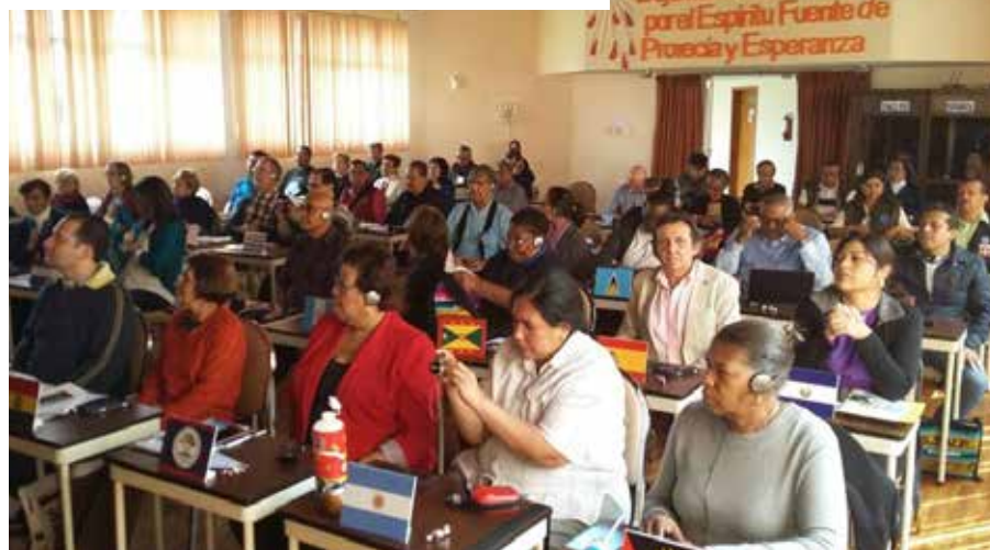
6º encontro hispano-americano, Quito, Equador

Com o desejo de desenvolver a fraternidade e a proximidade entre os confrades , ingrediente necessário para o desenvolvimento da Missão da SSVP no mundo, foram realizados encontros inter-