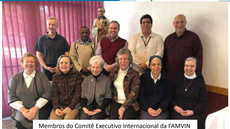
Membros do Comitê Executivo Internacional da FAMVIN