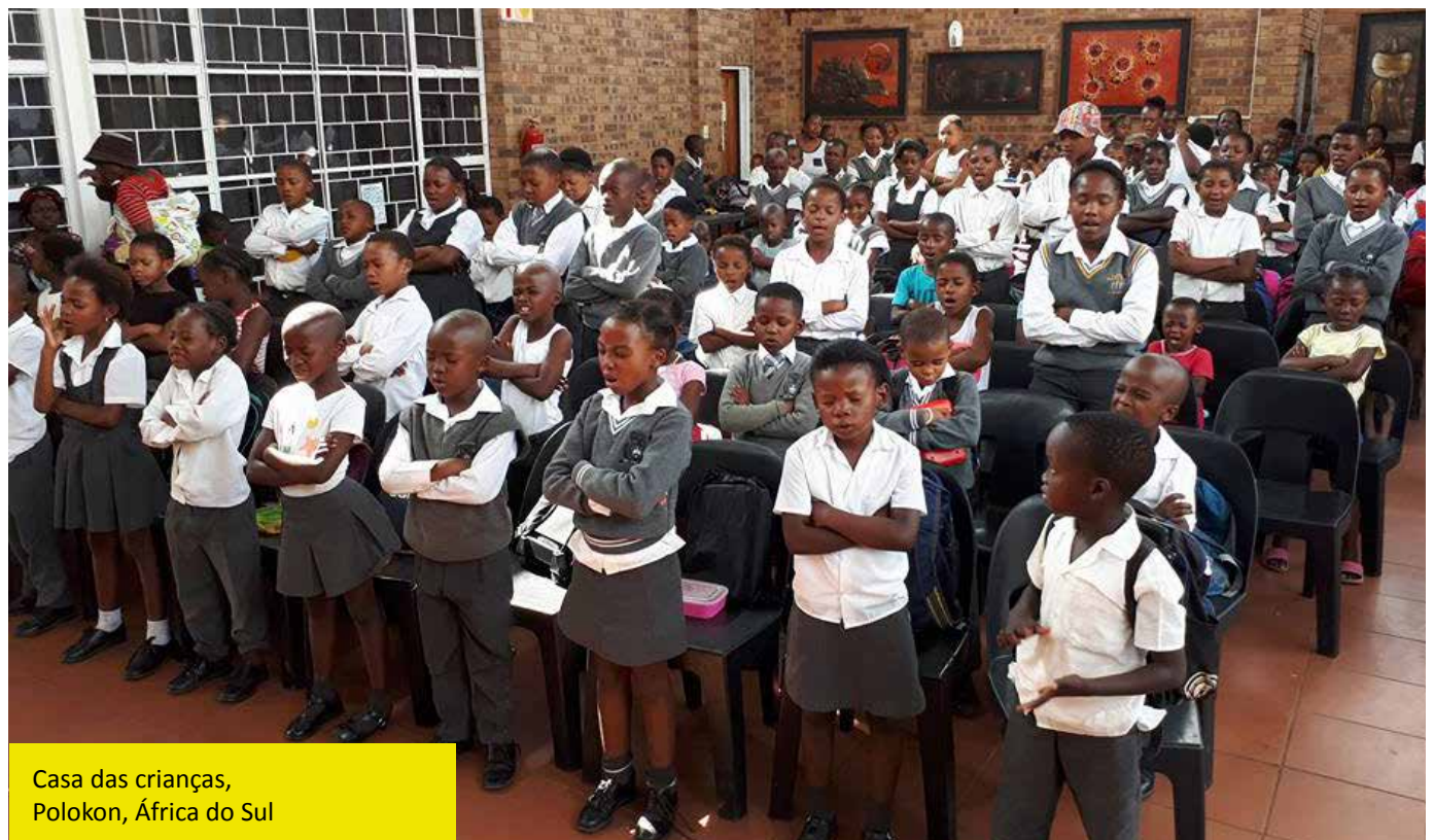
Casa das crianças, Polokon, África do Sul