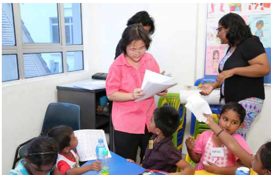
Aulas para crianças provenientes de um meio urbano

ESPERAMOS QUE OS JOVENS VICENTINOS DESTA ÁREA POSSAM PARTICIPAR DESTA INICIATIVA, REALIZANDO UM VOLUNTARIADO COMO PROFESSORES. ESTA SERÁ UMA BOA OPORTUNIDADE PARA CANALIZAR SEU TALENTO, ENERGIA E JUVENTUDE PARA UMA CAUSA QUE NÃO SÓ BENEFICIA AOS POBRES QUE ELES SERVEM, MAS TAMBÉM ENRIQUECE SUAS PRÓPRIAS VIDAS.