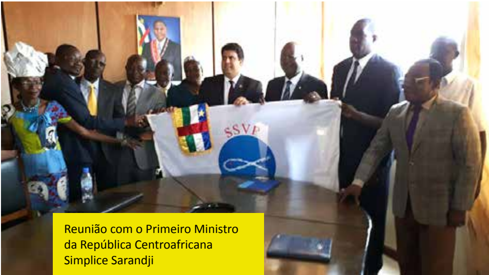
Reunião com o Primeiro Ministro da República Centroafricana Simplicie Sarandji

de boas obras já consolidadas, assim como muitas outras que estão dando seus primeiros passos e que foram inauguradas devido à chegada do Presidente Geral.