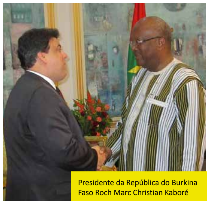
Presidente da República do Burkina Faso Roch Marc Christian Kaboré