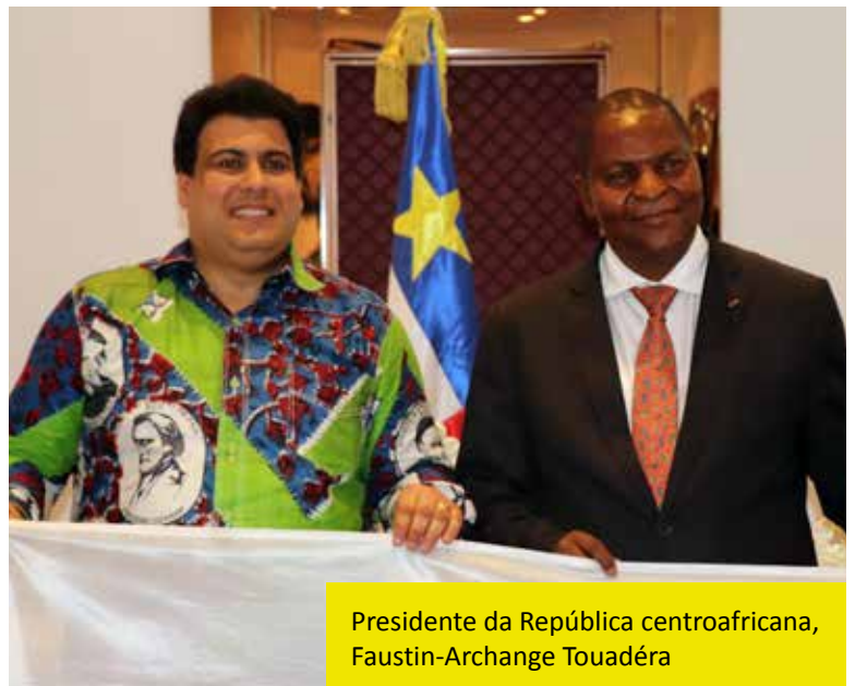
Presidente da República centroafricana, Faustin-Archange Touadéra

a SSVP está organizando o “Projeto Ozanam”. São mais de 20.000 metros quadrados de cultivo, uma atividade sustentável já que a metade da produção vai para as famílias necessitadas de ajuda e a outra para a manutenção do projeto.