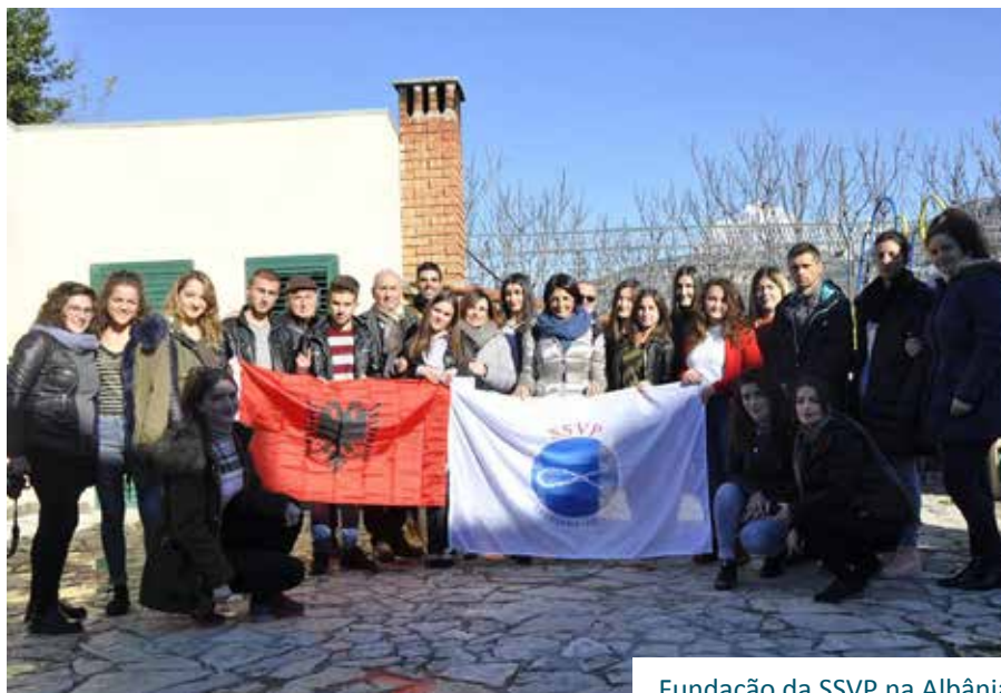
Fundação da SSVP na Albânia

O CONSELHO GERAL INTERNACIONAL ELABOROU UMA RETROSPECTIVA DAS ATIVIDADES REALIZADAS DURANTE O ANO DE 2017. ESTE É UM BOM RESUMO DOS MUITOS PROJETOS E INICIATIVAS QUE FORAM CONCLUÍDOS DURANTE TODO UM ANO DE SERVIÇO DO CGI, MAS TAMBÉM DAS MUITAS AÇÕES PLANEJADAS PARA O FUTURO DA SSVP, QUE EM SEU CAMINHO À MISSÃO ENCOMENDADA BUSCA SEMPRE O SERVIÇO AOS IRMÃOS MAIS POBRES E DESENVOLVER SUA FÉ NO CARISMA.