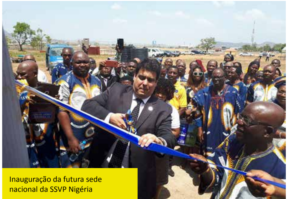
Inauguração da futura sede nacional da SSVP Nigéria

Da NIGERIA podemos destacar o grande trabalho de acompanhamento que nossos confrades realizam nas prisões , atendendo aos detentos, e também as visitas aos domicílios nos bairros mais pobres.