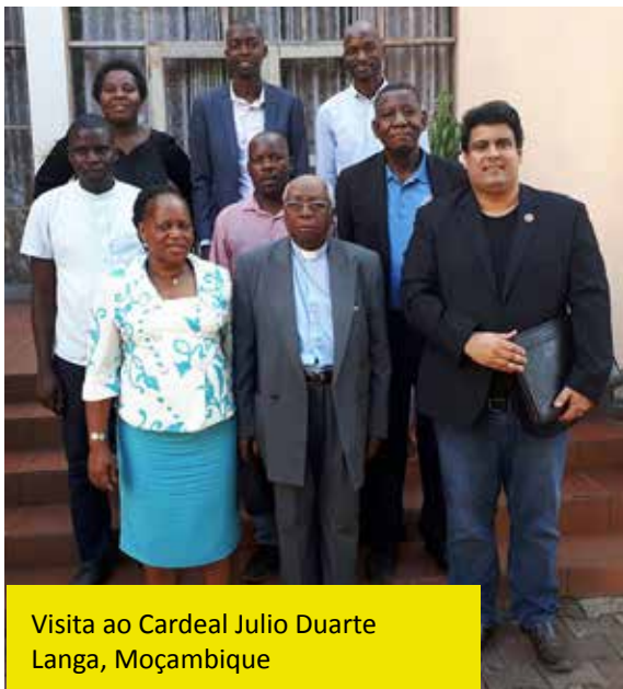
Visita ao Cardeal Julio Duarte Langa, Moçambique