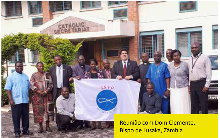
Reunião com Dom Clemente, Bispo de Lusaka, Zâmbia

Na ÁFRICA DO SUL , o Presidente Geral visitou a escola primária SSVP “São Mateus” e distribuiu lotes de alimentos nos bairros mais necessitados. Do mesmo modo pôde ver como a SSVP dava alimento a mais de 250 crianças diariamente e visitou a “Casa de Federico”, lugar onde vivem 30 pessoas acolhidas.