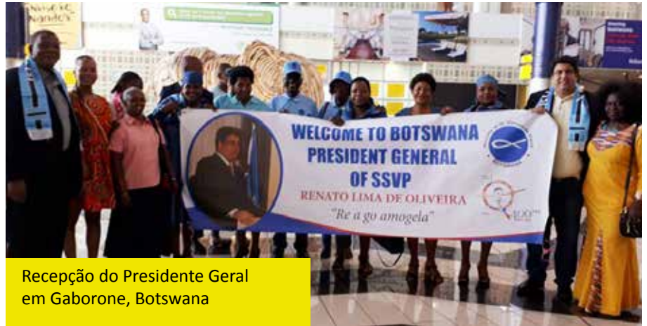
Recepção do Presidente Geral em Gaborone, Botswana