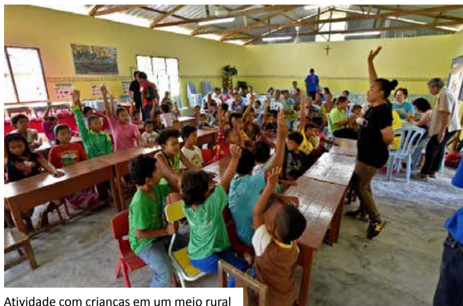
Atividade com crianças em um meio rural