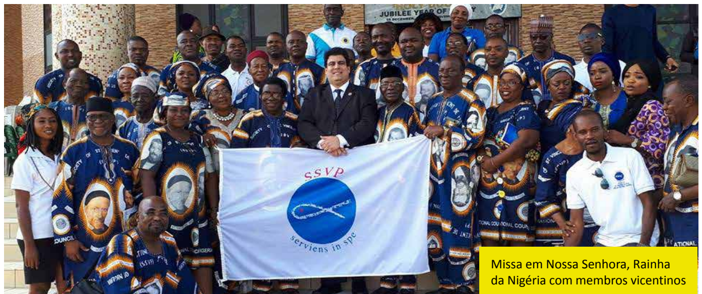
Missa em Nossa Senhora, Rainha da Nigéria com membros vicentinos