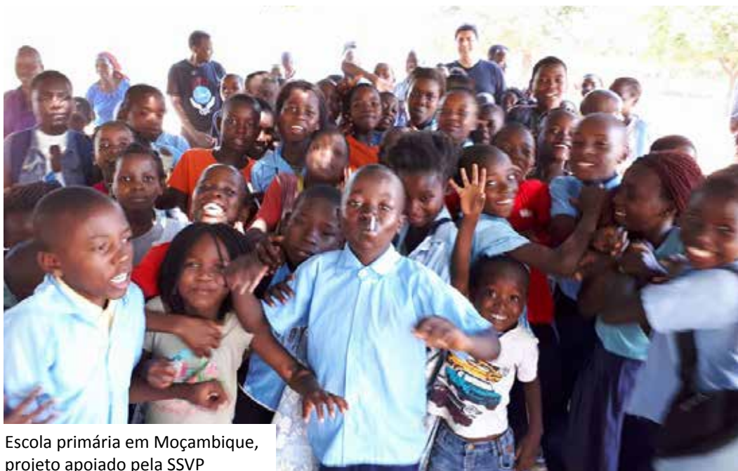
Escola primária em Moçambique, projeto apoiado pela SSVP