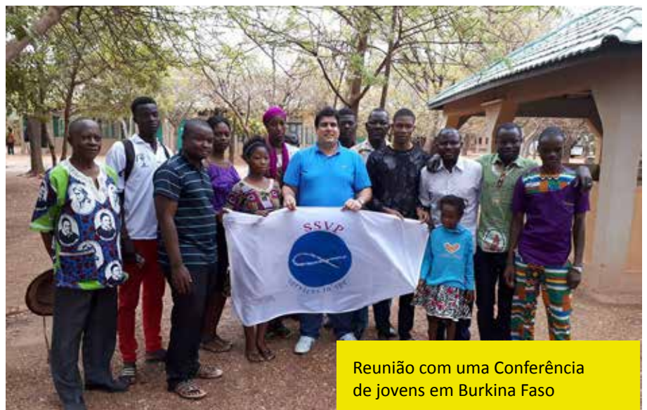
Reunião com uma Conferência de jovens em Burkina Faso

Em MOZAMBIQUE a SSVP tem uma forte conexão com os Ramos da Família Vicentina presentes no país e com a Igreja, realizando visitas a domicílio nos bairros mais pobres e realizando obras de caridade para a infância.