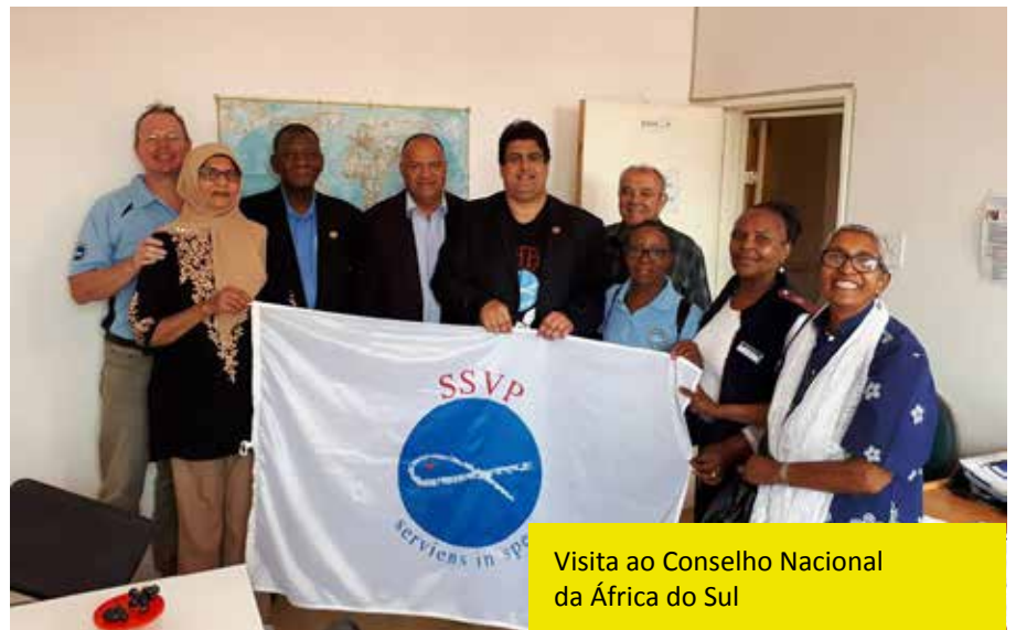
Visita ao Conselho Nacional da África do Sul

poucos recursos, mas com um incrível compromisso e imaginação de modo a melhorar a vida dos acolhidos”. “A caridade é inventiva até o infinito”.