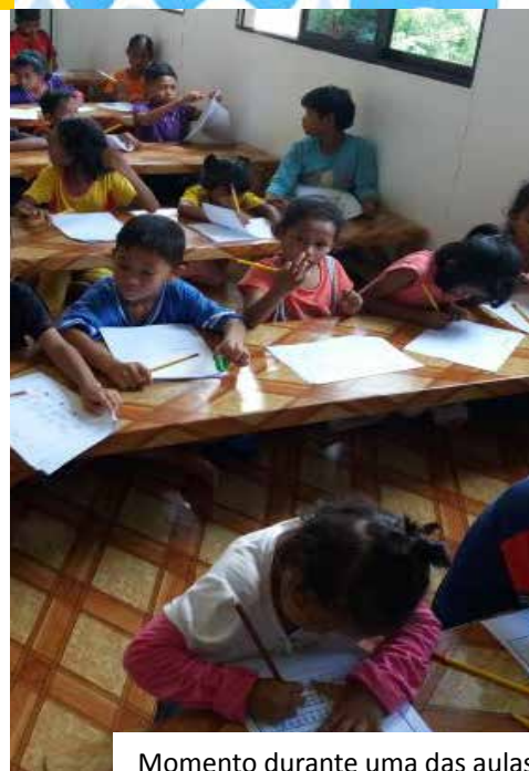
Momento durante uma das aulas

forma independente de qualquer programa escolar. Tem um plano didático simples, com lições que ajudam aos voluntários a dar as aulas de uma maneira eficiente. O progresso dos alunos está organizado em níveis de capacidade e não baseados na idade dos estudantes. Os alunos nunca são aprovados para passar ao nível seguinte até que não tenha aprendido o nível em que se encontra assim cada aluno aprende em seu ritmo e com respeito a sua habilidade. O objetivo deste programa