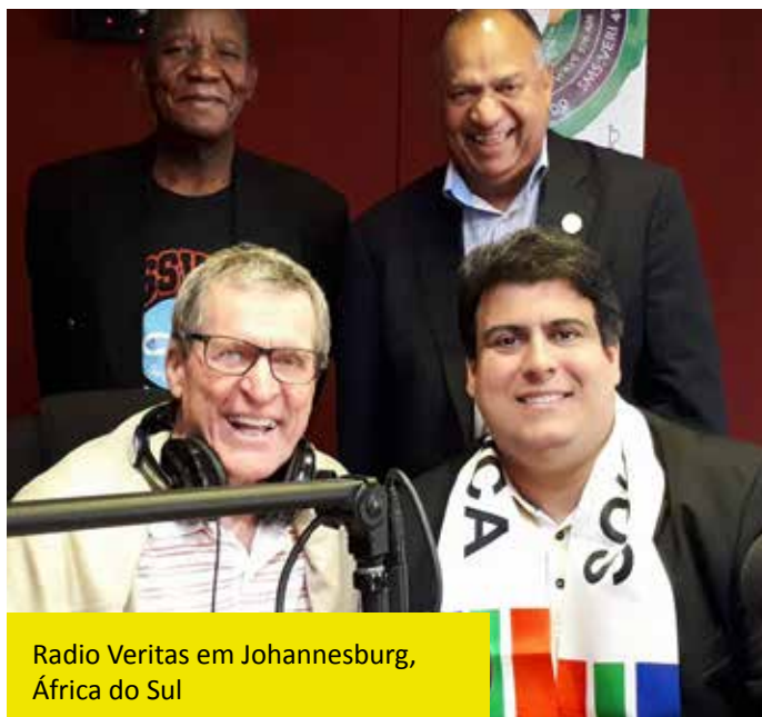
Radio Veritas em Johannesburg, África do Sul