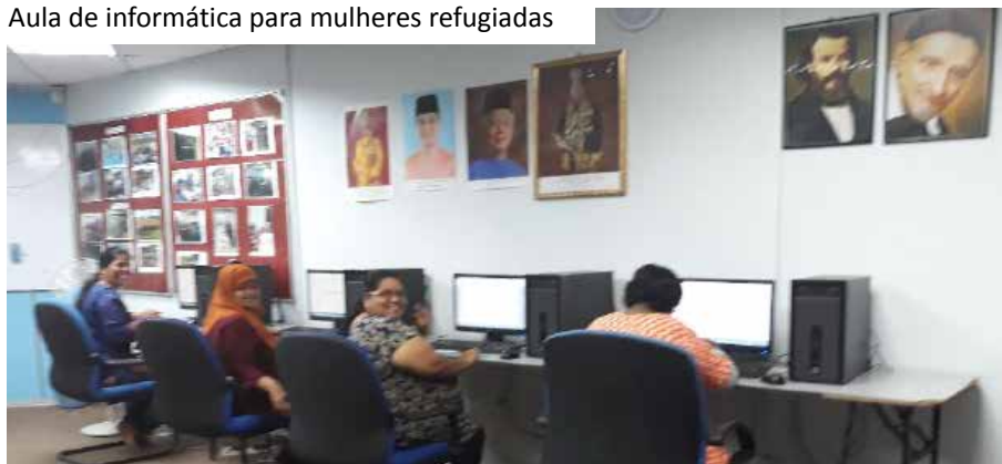
Aula de informática para mulheres refugiadas

é assegurar que os alunos adquiram habilidades através de uma educação básica e que por sua vez construam sua autoestima ao longo do caminho.