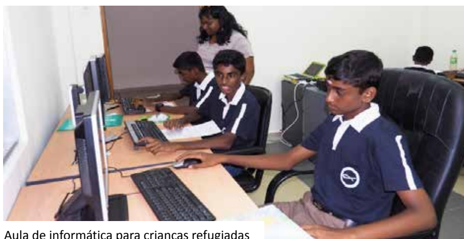
Aula de informática para crianças refugiadas