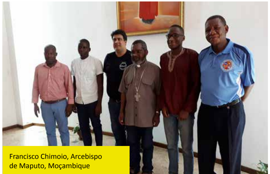
Francisco Chimoio, Arcebispo de Maputo, Moçambique