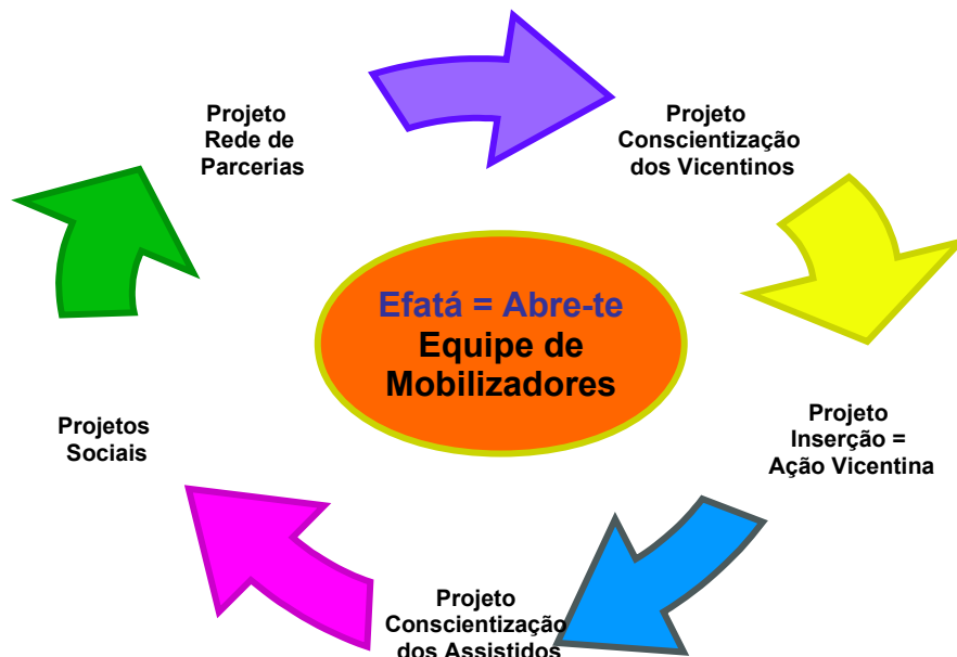
Ilustração do Programa:

O Programa contempla os projetos de Conscientização dos Vicentinos; Inserção/Ação Vicentina; Conscientização dos Assistidos; Projetos Sociais e Rede de Parceiros.